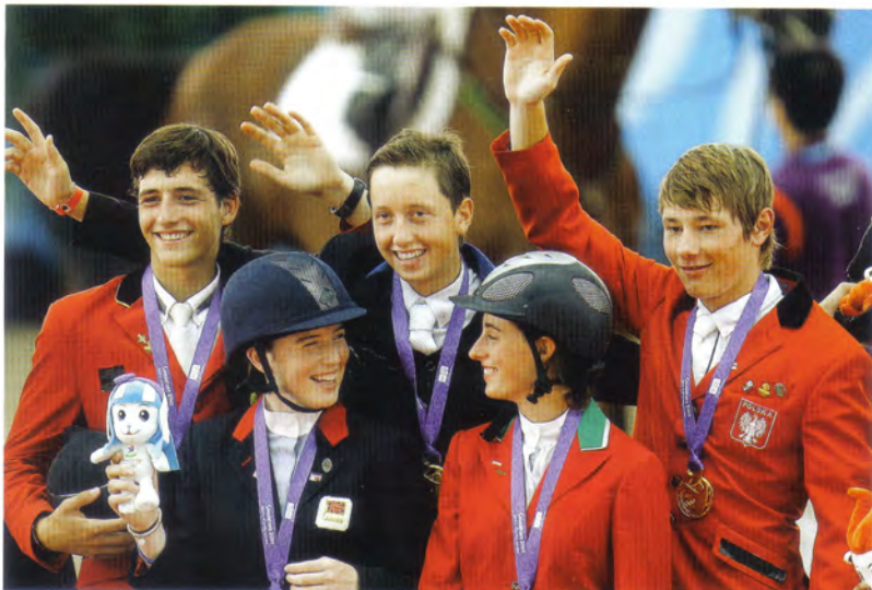
Olympic Gold for Europe